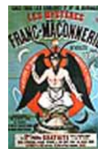
Cubierta de uno de los fascículos del «Canular de Taxil».

De otro lado, algunos autores católicos del siglo XIX han igualmente condenado el conjunto de la francmasonería debido a prácticas teúrgicas que consideran representativas. Es en este mismo contexto que ha aparecido el célebre Canular de Taxil .