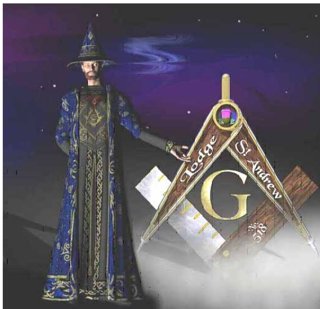
Interesante portada de la página Web de la Lodge «St. Andrew N° 518» - Province of Aberdeenshire East Grand Lodge of Scotland

La bondad de corazón y la equidad de un hombre honesto vale cien veces más que la amistad de un bellaco.